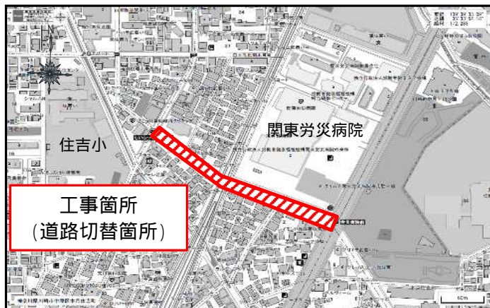
工事位置図(道路切替箇所)

北側沿線の車の出入りについては、切替後も通行出来るように致します。なお、工事の進捗により、お車を仮駐車場に移動して頂く際は、事前にご連絡致します。