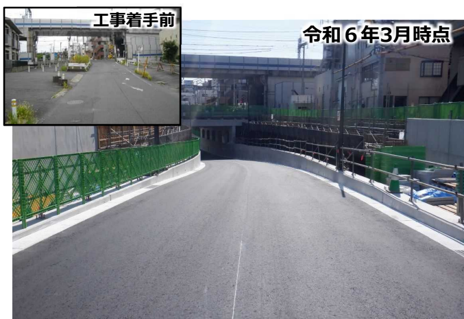
らいらっく保育園側から